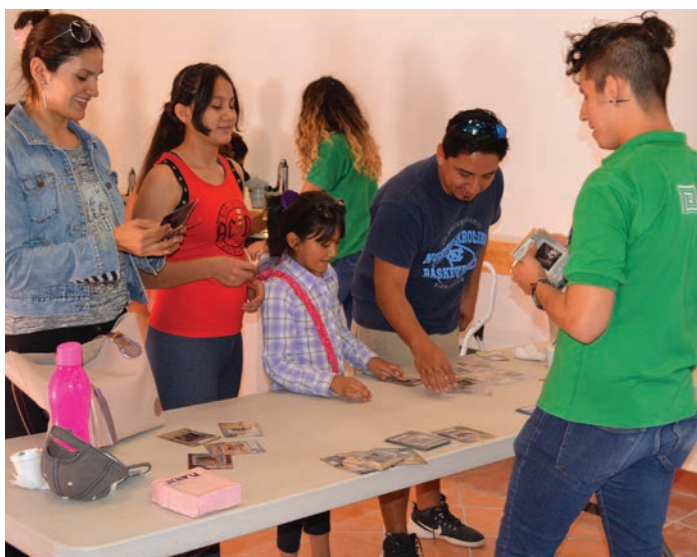
Actividades científicas y culturales coordinadas por la Fundación Todos por Cerro de San Pedro.

Es así como la Fundación Todos por Cerro de San Pedro inició formalmente sus actividades en el año 2017, y ha sido concebida como una organización de la sociedad civil, creada por la empresa Minera San Xavier, que funciona de forma independiente y con autonomía presupuestal, cuyo propósito es el de contribuir al desarrollo sustentable del municipio.