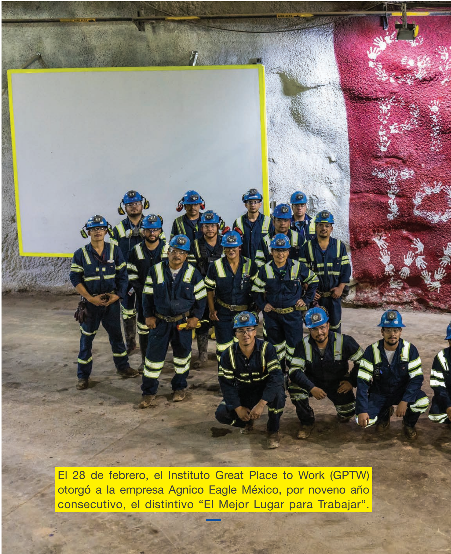
El 28 de febrero, el Instituto Great Place to Work (GPTW) otorgó a la empresa Agnico Eagle México, por noveno año consecutivo, el distintivo “El Mejor Lugar para Trabajar”.