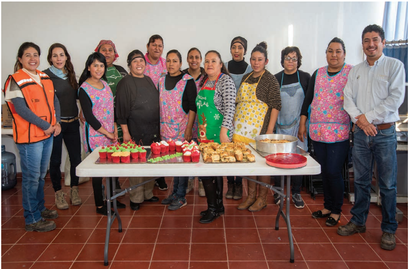
Programa de capacitación en repostería a mujeres de la comunidad de la Zapatilla en Cerro de San Pedro.

Minera San Xavier ha sido distinguida por más de diez años como Empresa Socialmente Responsable (ESR), por el Centro Mexicano para la Filantropía, A.C., (CEMEFI). Además, ha obtenido el prestigiado reconocimiento Outstanding Business Award COBA 2015, en el apartado de Responsabilidad Social Empresarial, otorgado por la Cámara de Comercio de Canadá en México (CANCHAM).