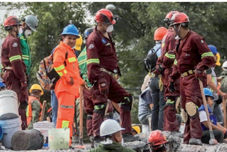
En 2017, las Cuadrillas colaboraron en el rescate de víctimas del sismo en la Ciudad de México.

De manera voluntaria, colaboradores de diferentes propiedades de Grupo México integran cuadrillas preparadas para responder ante un llamado de auxilio.