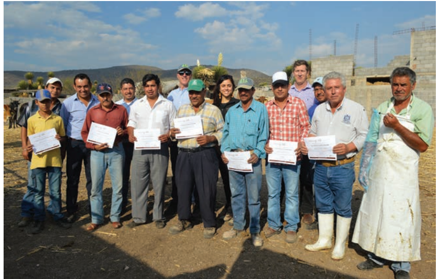
Impartición a habitantes de las comunidades de Curso de Inseminación Artificial en Bovinos.