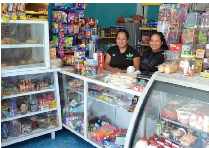
Proyectos de crecimiento de negocio financiados a través de las gestiones de la Fundación Todos por Cerro de San Pedro.

Se trata de una iniciativa que potencializará las actitudes, conocimientos y capacidades, para los próximos cambios que tendrán en su vida profesional, una vez que concluya el proceso de cierre de operaciones.