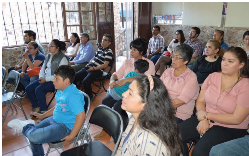
Programa de Desarrollo Económico Local.

En Minera San Xavier hemos concebido un Plan de Cierre Responsable, Incluyente y Participativo, por medio del cual los trabajadores de la empresa, las comunidades cercanas a nuestra operación y nuestros grupos de interés, nos encontramos participando en la construcción de la visión de futuro para el municipio de Cerro de San Pedro.