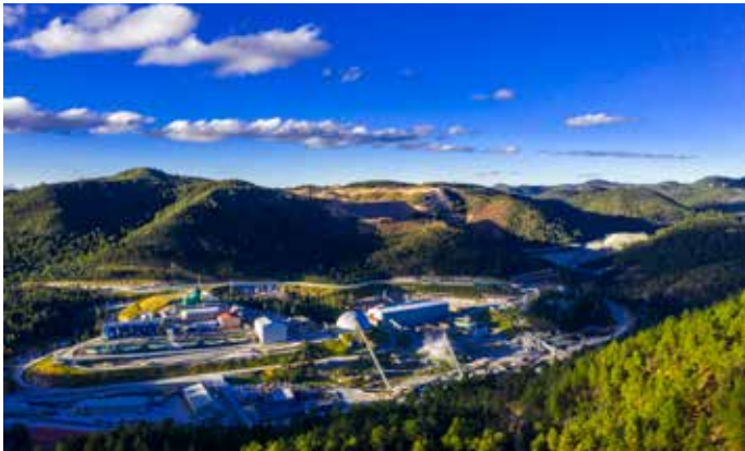
IMAGEN DE LA MINERÍA

A tres años de la implementación del Fondo Minero estimamos conveniente sea revisado, para que los recursos aportados lleguen de manera oportuna y sean asignados de forma eficiente, que las empresas mineras puedan presentar proyectos y que los Comités utilicen metodologías de “Presupuesto Participativo” en las que se identifiquen las necesidades urgentes para poderles incluir en los proyectos.